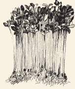
Brotos de alfalfa