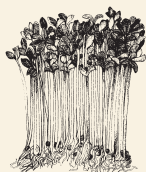
Brotos de alfalfa