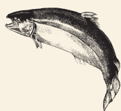
Aceite de salmón