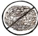
Libre de Grano