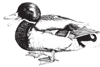
Pato de Gressingham